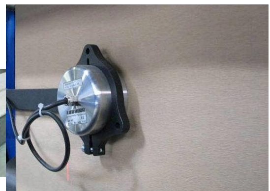
Litronic-FMS II Sensor zur Messung von Papp- und Filzbahnen, Kartonagen.

Ihr Ansprechpartner für Beratung, Verkauf, Service