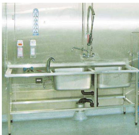
Spültisch in Hygienezone Évier dans la zone d'hygiène.

■ Elektro: Bei der Elektroinstallation in der Lebensmittelindustrie hat sich der Einsatz offener Gitterrinnen durchgesetzt. Die Kabeltrassen sollten nicht überfüllt und die Kabel in horizontalen Strecken nicht gebunden, sondern nur geordnet eingelegt werden. In Räumen der höchsten Hygienestufen sind die Kabeltrassen ausserhalb oder verdeckt zu führen und die Maschinen möglichst von